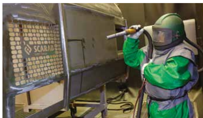
Grenaillage de la trémie en acier inoxydable