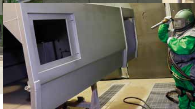
Gehäuse des Kehrgutbehälters aus Edelstahl wird sandgestrahlt

Der Kehrgutbehälter ist aus robustem, korrosions- und abriebfestem 4003er-Edelstahl gefertigt, der vor dem Auftragen einer Zweikomponenten-Epoxyd-Grundierung und einer anschließenden Beschichtung mit einer strapazierfähigen Deckschicht kugelgestrahlt wird.