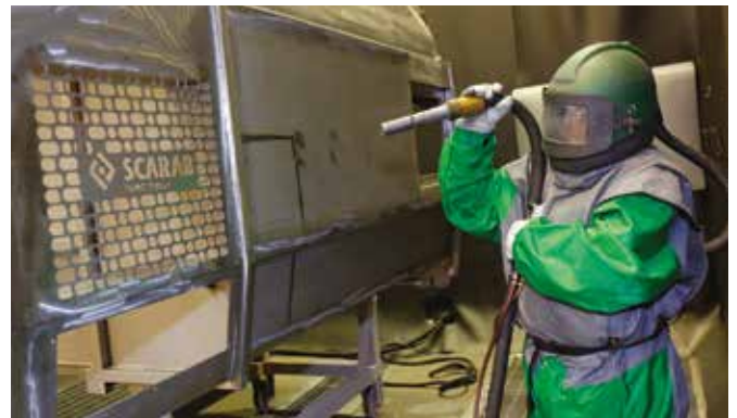
Kehrgutbehälter aus Edelstahl wird sandgestrahlt