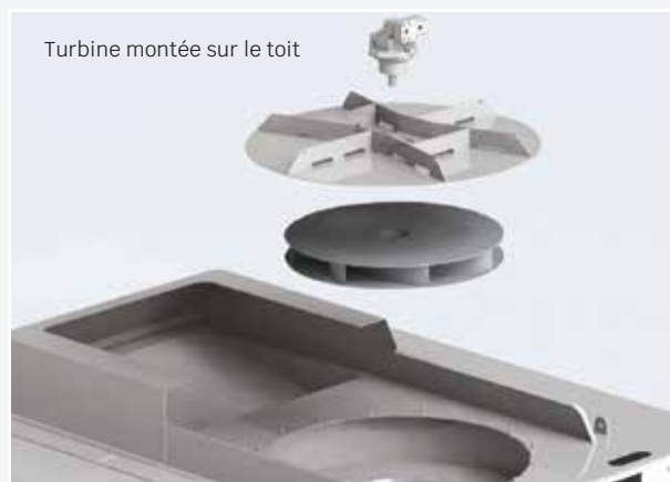
Turbine montée sur le toit

Le tamis à particules, un filtre à mailles en acier inoxydable articulé, est plissé pour offrir une surface maximale et réduire les risques de blocage ; il bascule également vers le bas pour faciliter le nettoyage.